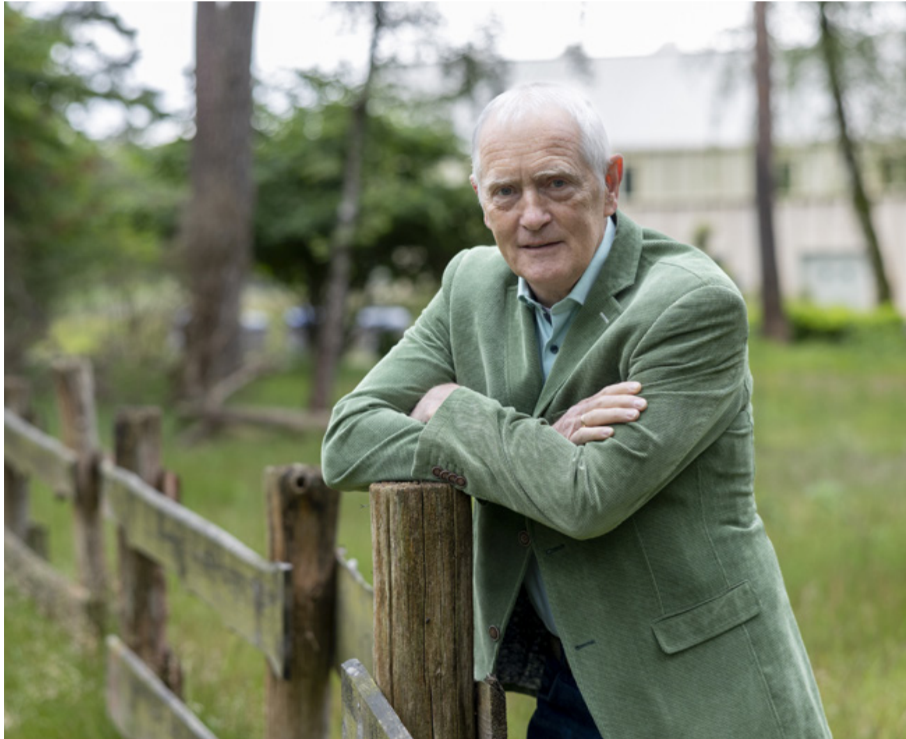
Peter van Uhm

Lid Raad van Toezicht / Member of the Supervisory Board